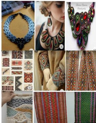
Рис.1. Дошка натхнення

У розробці колекції верхнього жіночого одягу використано формоутворюючі елементи українських блуз, суконь, пальт ХІХ –ХХ ст.: форми і характер драпірування рукавів, декорування ткацькими мотивами; кольорова гама – коричневий, приглушені відтінки зеленого. Дошка натхнення показана на рис. 1. Призначення колекції – етно пальто складного крою, з елементами ткацтва для жінок віком 30-45 років (рис. 2). Під час створення колекції були використані сучасні тенденції 2023-2024 років.