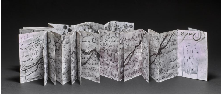
Рис. 2. Christine Khonjje, "The poet's coat" («Пальто поета»), 2011.

Крістін Хонджі. Шрифтовий візерунок на одній зі сторінок книги є відтворенням вірша перського поета Хафеза, що утворює хаотично-ритмізовану форму у колекції «The British Museum» понад сорока артбуків різного характеру [4].