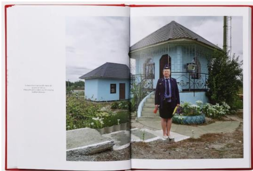
Рис. 3. Саша Маслов "UKRAINIAN RAILROAD LADIES" 2020 р.

Серед видавництв, де створюються артбуки та реалізуються художні проекти - ArtHuss, Ist publishing, Родовід, Osnovy Publishing. В останній в 2020 р. було здійснене видання мистецької фотокнижки «UKRAINIAN RAILROAD LADIES» Саші Маслова (рис. 3), присвячене професії провідниці. Лейтмотивом книги стало звичайне буття робітниць української залізниці, які живуть «на колесах» у окремому «плацкартному світі». Їхні образи передають авторські фотопортрети, що створюють узагальнений образ жінки-провідниці.