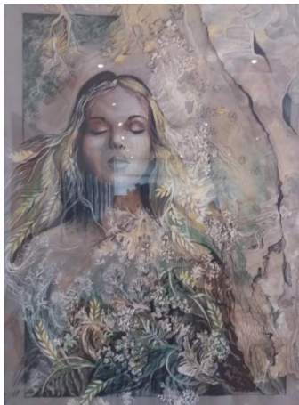
Рис. 1 Роботи сучасних художників книжкової ілюстрації: а - ілюстрації до твору «Лісова пісня», автор: Поліна Дорошенко; б - ілюстрації до інтерактивної книжки «Котигорошко», автор: Іван Сулима;