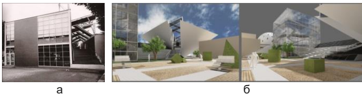
Рис. 2. Виставкові галереї: а – виставковий павільйон К. Мельникова у м. Париж; б- виставкові галереї музею архітектурного простору

Архітектурна поезія запроєктованого музею розкривається з основного входу з вулиці Грецької. Першою з'являється галерея у вигляді перевернутої піраміди, яку пронизує діагональний хід, нагадуючи вхідну групу з проекту павільйону К. Мельникова. У центрі музейного комплексу розташовується куб, який схожий на гараж для таксі К. Мельникова. У серці об'єму оберненої піраміди розташована адміністративна частина, а верхні поверхи віддані обхідним галереям. Центральною композицією плану музею є галерея у вигляді скляного куба, в середині якого створено цікаву систему пандусів, що віддзеркалює проект гаража (рис. 2).