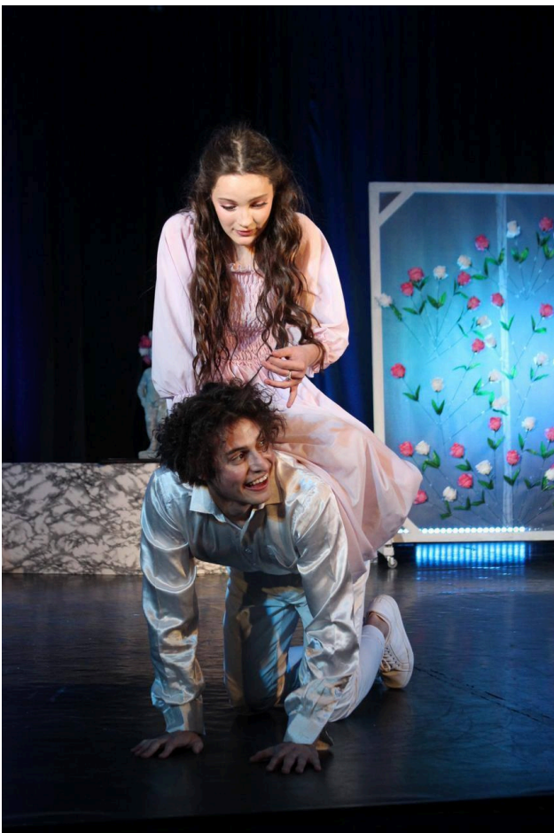
Фото 1. 1-й акт вистави “Як важливо бути Earnest”.

Таким чином, всі костюми, що використовуються у виставі, повинні відповідати класичним канонам британської моди Золотого віку, а аксесуари виконані у вікторіанській британській моді.