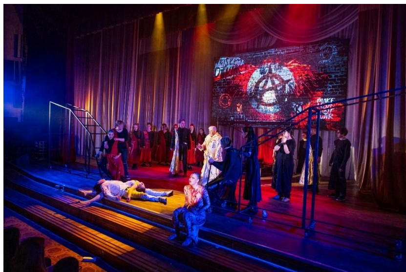
Фото 3. 2-й акт вистави «Ромео та Джульєтта» Всі учасники вистави