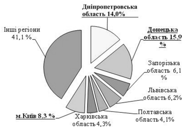
Рис. 1. Діаграма кількості нещасних випадків по регіонах України за 2015 рік

Результати досліджень. Одним з головних напрямів роботи служб з охорони праці є профілактична робота із запобігання нещасним випадкам на виробництві, професійним захворюванням та іншим випадкам загрози здоров'ю осіб, викликаним умовами праці. За статистичними даними, впродовж останніх років існує тенденція збільшення виробничого травматизму [2]. Водночас статистичні дані не відображають реального стану промислової безпеки та охорони праці, оскільки не враховують економічну динаміку, рівень життя населення та інші чинники. Як наслідок, ризик зазнати травму на виробництві продовжує залишатися високим. Збільшується також відсоток кількості випадків травмування з важкими наслідками до загальної кількості травмованих. На рис. 1 наведено відсоткове співвідношення кількості нещасних випадків по регіонах України за 2015 рік.