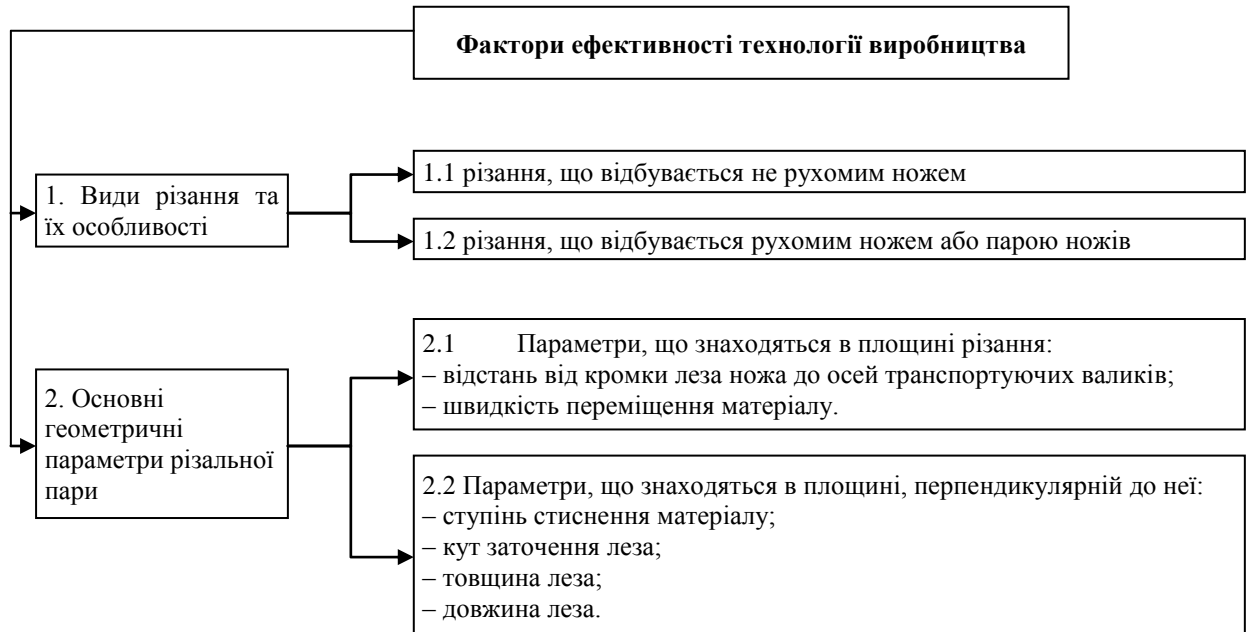
Рис. 2. Фактори, що визначають ефективність технології виробництва

По-третє, кут загострення леза впливає на процес різання, жорсткість, стійкість і довговічність ножа (зменшення гостроти леза ножа впливає на якість отриманої деталі та на енергетичні витрати на процес повздовжнього різання).