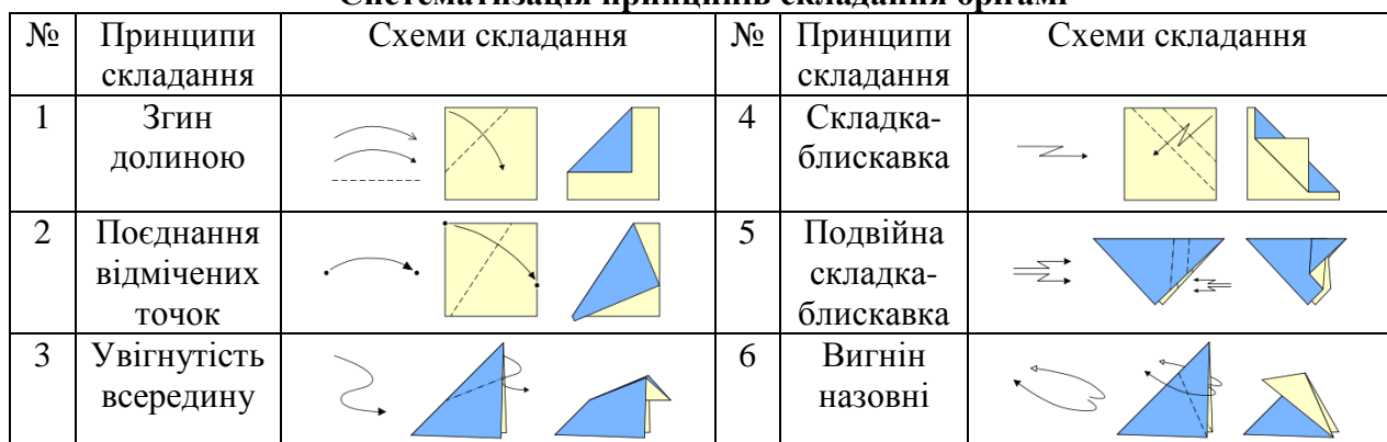
Систематизація принципів складання орігамі