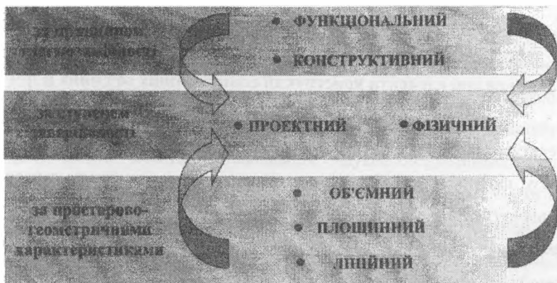
Рис. 3. Класифікаційна схема формування типів модулів

На різних етапах процесу розробки нових моделей одягу зустрічаються всі чотири типи задач. Очевидно, що найефективніше використання комп'ютерної техніки можливе саме у випадку роботи з об'єктами першого типу. Оскільки "модуль є геометричною, параметричною, конструктивною основою й первинним елементом серійного проектування", то в конструюванні одягу спостерігається прагнення до формалізації об'єктів шляхом приведення їх до завдання обмеженої кількості конструктивів (модулів, блоків, примітивів) [3]. Отже, з урахуванням можливостей комп'ютерного проектування модульні принципи розробки нових виробів мають найбільшу перевагу. Разом з тим їх реалізація є найскладнішою, оскільки для вирішення цієї задачі необхідним є виявлення об'єктивних закономірностей та зв'язків між параметрами конструкції, які б забезпечили можливість виділення та комбінування конструктивних модулів [4, 5]. В результаті аналізу існуючих методів модульного проектування й виробництва, що застосовуються в архітектурі, суднобудуванні, приладобудуванні, при виготовленні меблів, радіо- й електронної апаратури сформовано відповідну класифікаційну схему модулів (рис. 3) [5].