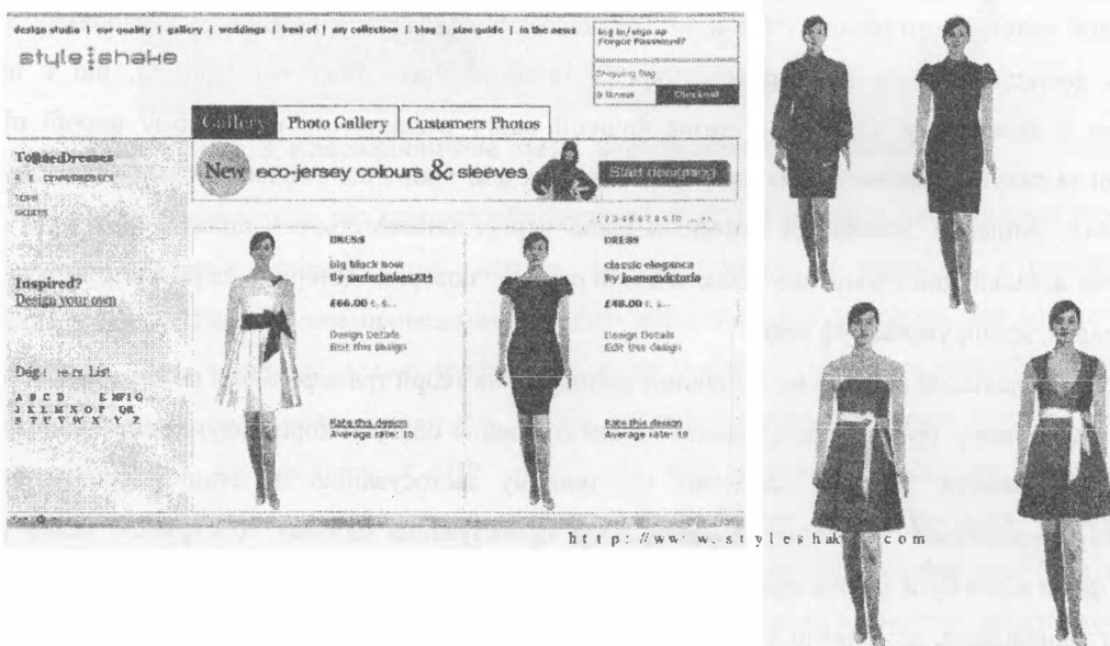
Рис. 1. Формування жіночої сукні з конструктивних елементів

Відомо, що дослідження й застосування методів, що базуються на принципах трансформації існуючих об'єктів або їхніх частин тривають майже сторіччя. Проте теоретичне обґрунтування можливостей їхнього застосування в процесі створення одягу було започатковано в розробці дизайн-концепції проектування одягу, яка дозволяє здійснювати комбінаторний синтез нових моделей на основі матриці ескізних елементів (системи “конструктор”) з наступною реалізацією їх на етапі конструкторської розробки [1,2]. Яскравим прикладом реалізації дизайн-концепції в умовах сучасного проектування та виготовлення одягу є те, що сьогодні в країнах Європи успішно працюють в мережі Інтернет віртуальні ательє, на сайтах яких споживачу пропонується виготовлення індивідуального замовлення, яке формується з готових елементів одягу. При цьому надається каталог матеріалів для виготовлення певного виду одягу, споживач вказує індивідуальні параметри фігури та формує бажаний виріб не тільки з основних деталей або вузлів, але й вибирає фурнітуру й варіанти оздоблення. На рис. 1 наведено приклад формування в англійському ательє святкової жіночої сукні з елементів ліфа, спідниці й рукава, яке може виконати самостійно будь-яка жінка.