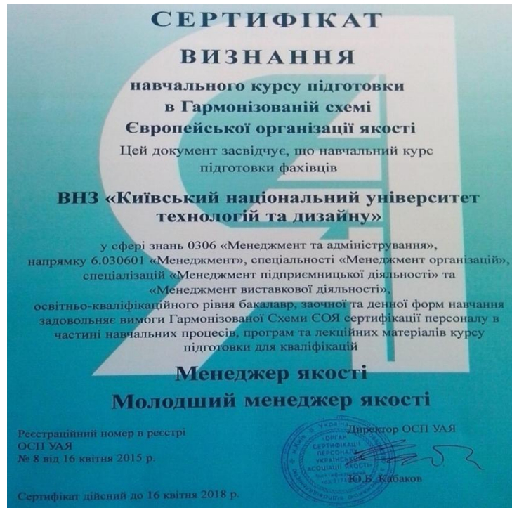
Рис. 3. Сертифікат визнання навчального курсу підготовки в Гармонізованій схемі Європейської організації якості виданий КНУТД

потреби в ньому на ринку праці. Студенти які націлені працювати за кордоном, в країнах Європейського Союзу, потребують сертифікату європейського зразка. А це важливо в умовах глобалізації і є ще одним кроком до Європейського Союзу.