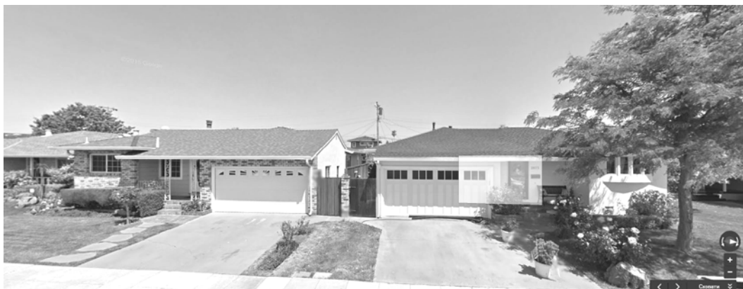
Рис. 1. Групові будинки для людей з обмеженими можливостями: Гінневер-стріт, Сан-Матео, Каліфорнія ( http://specialneedsanswers.com/california-special-needs-planners )

Більшість групових будинків є стандартними, односімейними будинками, придбаними групою адміністраторів і адаптованими для життя людей з обмеженими можливостями. За винятком наявності пандусів для інвалідних колясок, ці будинки ззовні практично не відрізняються від інших. Груповий будинок може бути розташований в будь-якій місцевості незалежно від її соціально-економічного статусу. Розміри будинку визначаються фінансовими і експлуатаційними міркуваннями. Чим більший будинок, тим важче проектувальнику забезпечити домашню обстановку. Як правило, в таких будинках проживає не більше шести осіб плюс кваліфікований персонал, що працює 24 години на добу. Зазвичай передбачається ряд невеликих кімнат разом із загальними приміщеннями, в тому числі вітальнею, їдальнею і кухнею з підсобними приміщеннями, а також кімнатою відпочинку та приміщеннями адміністрації. Більш складні схеми групових будинків нещодавно були запозичені зі Скандинавії. Вони являють собою колективне житло – форму будинку групового проживання, що відрізняється більш вишуканими індивідуальними приміщеннями. Але склад загальних приміщень такий же, як і в звичайних будинках групового проживання.