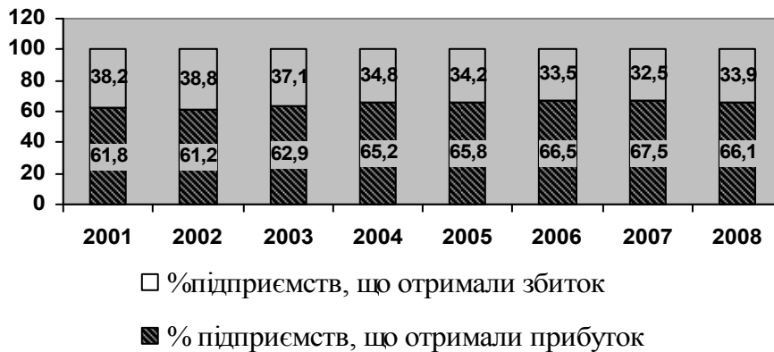
Рис.2. Частка прибуткових та збиткових підприємств України в 2001–2008 рр. (за даними Держкомстату України [3])

Проте, характерним для всіх періодів є майже стабільне співвідношення підприємств, що працюють у прибуток і в збиток. Збитково працювали від 38,8% до 32,5% підприємств і їхня кількість зменшувалася до 2008 року. Відповідно, доля прибуткових підприємств збільшувалася (рис.2).