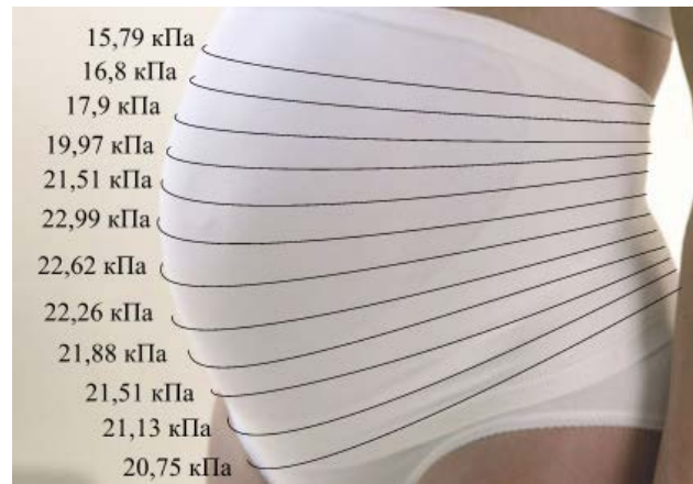
Рис. 2. Величини конфігураційних зусиль на тіло жінки бандажів-трисів [авторська розробка]

рекламується за свій відмінний зовнішній вигляд, але його функціональні властивості гірші, ніж у будь-яких інших аналогічних виробках.