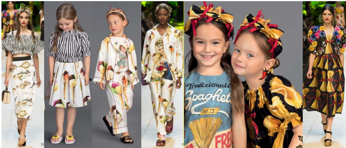
Рис 1. Приклади однакових дитячих та дорослих моделей одягу бренду Dolce & Gabbana сезону S/S 2017 [15]

Проаналізувавши колекції дитячого одягу будинків моди Dior, Chanel, Dolce&Gabbana тощо, можна зробити висновок, що моделі даних брендів значно дорожчі порівняно з виробами модних торгових марок середнього класу, які мають таку ж якість та відповідають споживчим вимогам. Торгові марки H&M, ZARA, Gulliver тощо вдало копіюють вироби представлені зазначеними вище будинками мод та користуються популярністю у споживачів [16].