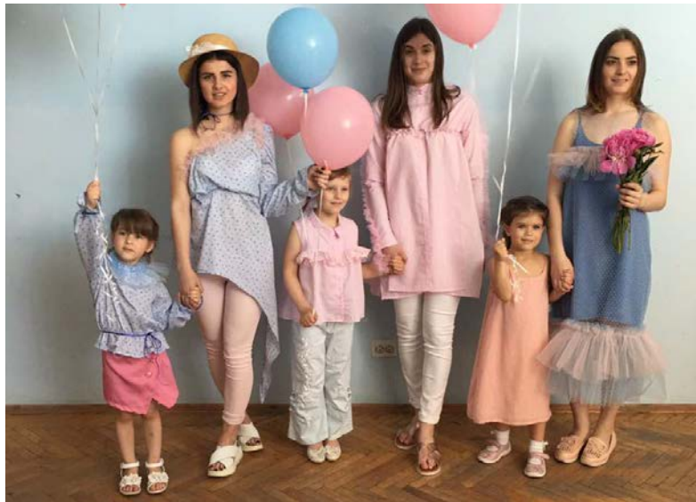
Рис. 4. Моделі колекції «маленький-дорослий» (автори Т. Богомазюк, О. Ісаєв)

Висновки. Проаналізовано колекції дитячого одягу відомих брендів, виконано аналіз фешн-ринка дитячої моди, визначено сучасні тенденції дитячої моди та правила формування колекцій одягу у стилі «family look». Проведено анкетне опитування споживачів та визначено потреби споживачів та їхні пріоритети при виборі дитячого одягу. Проаналізовано колекції світових брендів на прикладі бренду Dolce&Gabbana сезону S/S 2017 та визначено принципи формування асортименту колекцій дитячого одягу. На основі аналізу модних тенденцій, правил формування асортименту колекцій прет-а-порте та потреб споживачів дитячого одягу розроблено колекцію одягу для дівчаток та жінок у стилі «family look», яку представлено на міжнародному конкурсі молодих дизайнерів «Печерські каштани» (м. Київ, КНУТД, 2017 р.).