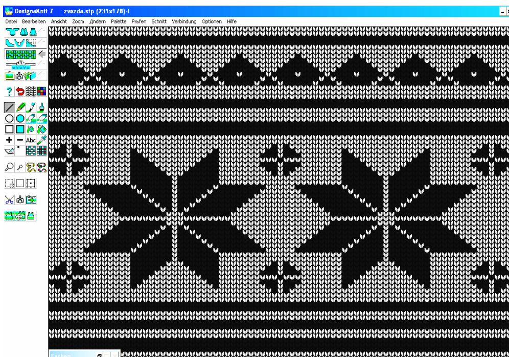
Рис. 4. Фрагмент візерунку у режимі «Дизайнер узоров»

Для рушників і стрічок візерунки розроблені за допомогою спеціалізованої комп'ютерної програми DesignaKnit 7. Вона являє собою потужну програму CAD/CAM для створення моделей в'язаних виробів. Програма включає різні модулі малювання лекал виробів, розробку схем візерунків, інтерактивне в'язання, графічну студію для маніпуляції графічними файлами, фотографіями та відсканованими зображеннями (рис. 4).