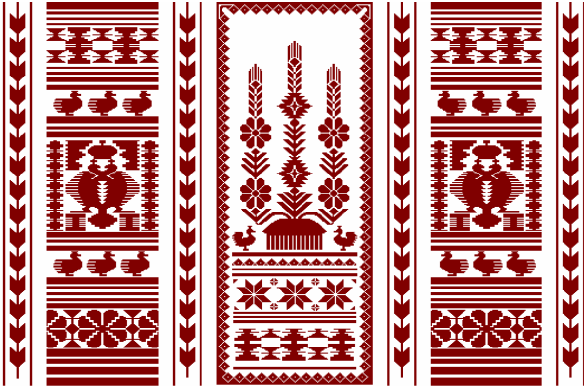
Рис. 2. Варіант компонування трикотажних виробів для панно

рушників обрано білий і червоний колір. З цих елементів створено декоративне панно у формі триптиху (рис. 2).