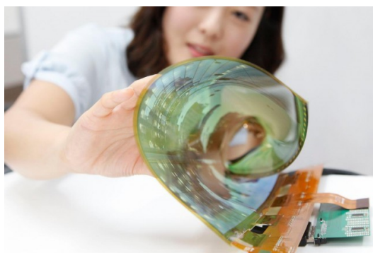
Рис. 5. Концепт гнучкого екрану від компанії LG

Для практичного впровадження нами обрано напрям інноваційних технологій з використанням LED-екрану. Творчим джерелом для розробки колекції моделей одягу стали концепти гнучкого екрану, представлені світовими компаніями Samsung, LG, Lenovo та іншими на всесвітніх виставках 2014–2016 рр. Компанія Lenovo на конференції Tech World 2016 у Сан-Франциско продемонструвала власні прототипи гнучких пристроїв – смартфона і планшета. Компанія Samsung продемонструвала прототип гнучкого дисплея (рис. 5).