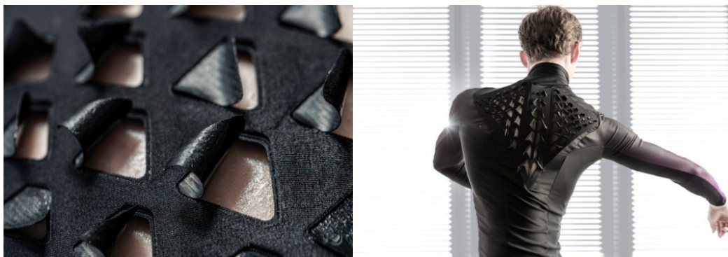
Рис. 3. Смарт-одяг компанії New Balance