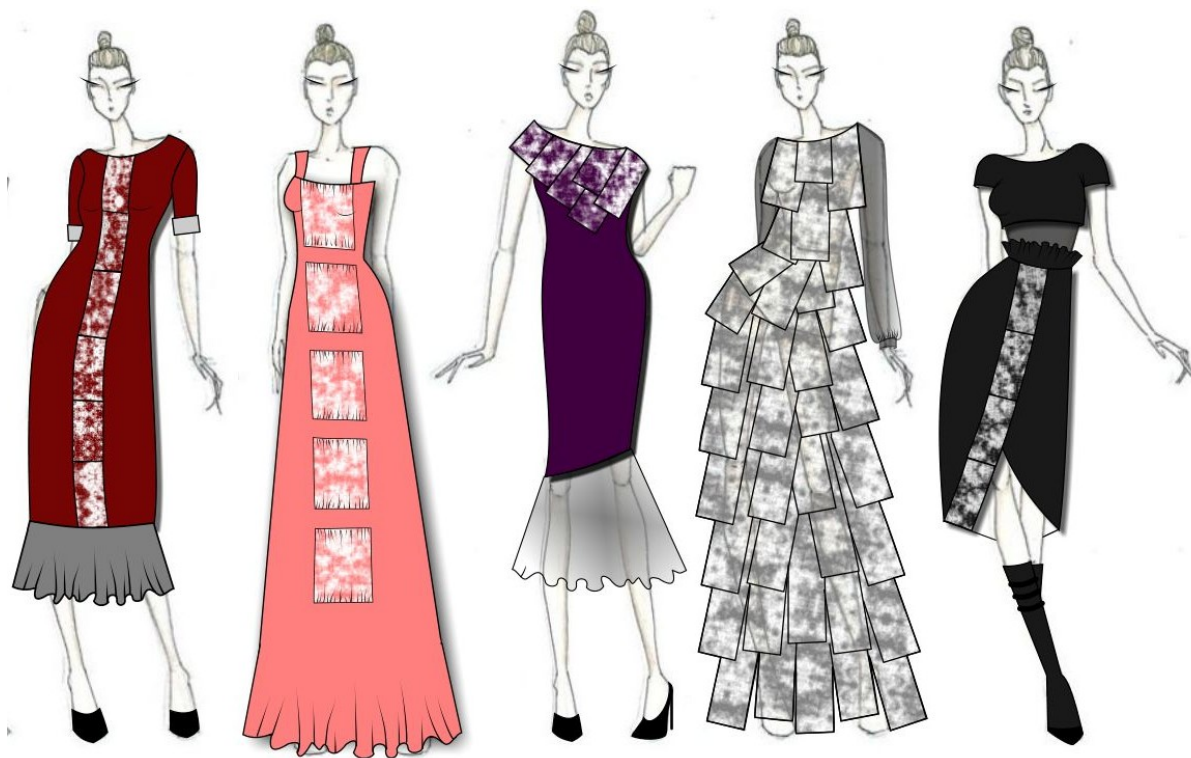
Рис. 6. Колекція сценічного одягу з використанням гнучких екранів

Мета колекції – створення концепту «одяг–екран». Створення авторської колекції одягу – арт-проект, як вираження світогляду, як реакція на те, що відбувається у світі. Колекція виконана у стилі хай-тек, характерними рисами якої є прямі силуети та геометричні лінії (рис. 6).