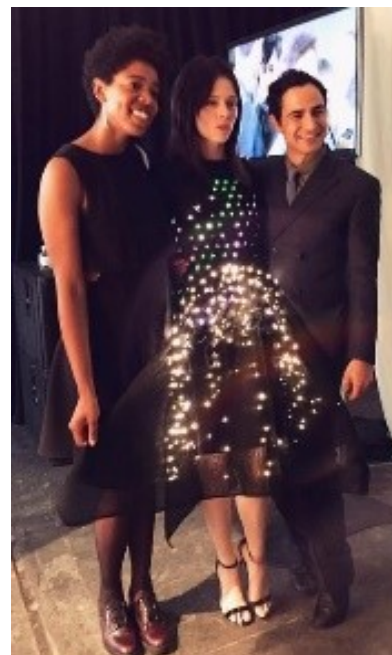
Рис. 4. Сукня зі світлодіодами Zac Posen, 2015 р.

Компанія Google представила технологію щодо запровадження в звичайні тканини спеціальних кондуктивних ниток. Ці нитки перетворюють тканини в чутливі панелі, з якими користувач може взаємодіяти так само, як з екранами смартфонів або планшетів. Таким чином, тканина перетворюється на сенсорний екран. Першим партнером технологічного гіганта став Levis. Джинсова куртка Levis з вплетеними кондуктивними нитками в джинсову тканину була спроектована спеціально для велосипедистів. У рукав куртки вшиті сенсори – датчики, завдяки яким розпізнаються жести. Куртка зв'язується за допомогою бездротової технології Bluetooth зі смартфоном зі спеціальним мобільним додатком. Користувачі за допомогою жестів можуть управляти мультимедійним плеєром,