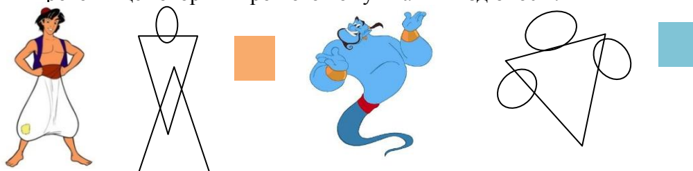
Рисунок 2 - Персонажі анімаційної стрічки «Аладін»: Аладін та Джин

народжує відчуття свіжості [1; с. 54]. Нижня частина обличчя досить велика із широким ротом - це говорить про його комунікативні здібності.