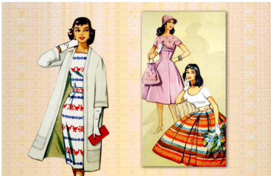
Рис. 3. Моделі Київського будинку моделей одягу, представлені на Міжнародних конгресах моди у Празі та Познані. Художники Шейнбаум Л. Я. та Забанова Т. Н., 1959

нового образу з традиціями старовинного українського ткацтва було високо оцінено європейськими фахівцями.