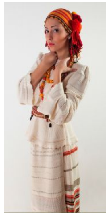
Рис. 15. Моделі Республіканського будинку моделей трикотажних виробів («Хрещатик»). Художники Старовойтова Н, Попова Н., 1980-ті роки