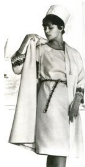
Рис. 7. Нарядний ансамбль «Весна». Художник Флідермауз К., Управління побутового обслуговування (Київ), 1965

Модель на рисунку 7 – це пропозиція служби побуту. Слід зазначити, що ательє індивідуального пошивку одягу в Радянському союзі вирішували, значною мірою,