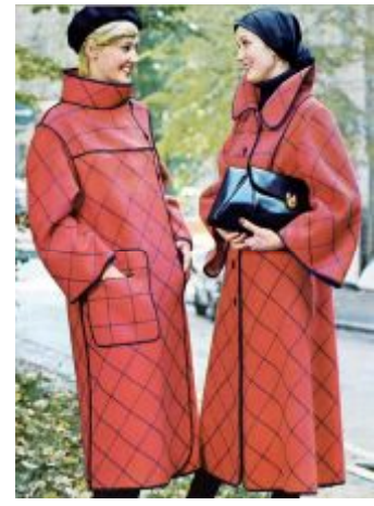
Рис. 14. Павлова Л. Донецький будинок моделей, 1978