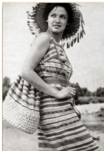
Рис. 6. Модель КБМО. Художник Іріскіна О., 1965