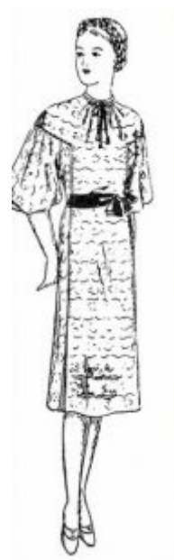
Рис. 2. Модель з «Альбому фасонів швейних виробів», Харків, 1940 р.

Подолання цієї проблема – складне завдання, коли мода існує в умовах жорсткого стилістичного диктату. В 1950–1960-ті роки головною ознакою європейського модного одягу були певні форми та крій, орієнтовані на створення досить конкретного образу, елегантного та жіночого – так званого «н'ю-лук». Порухити цю вимогу означало відхід від актуальних трендів. Завдання збереження