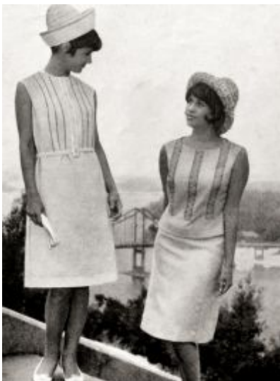
Рис. 5. Моделі КБМО. Художники Болдирєва Л. та Колежук Т., 1965