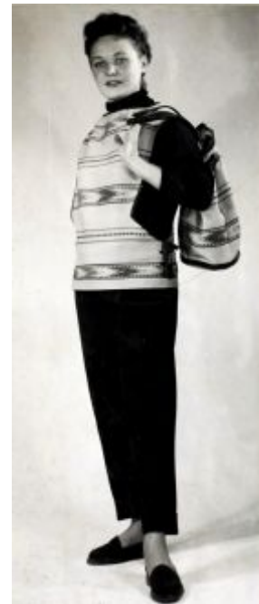
Рис. 4. Модель Львівського будинку моделей, представлена на Всесвітній виставці у Брюсселі. Художник Бала М. В., 1958