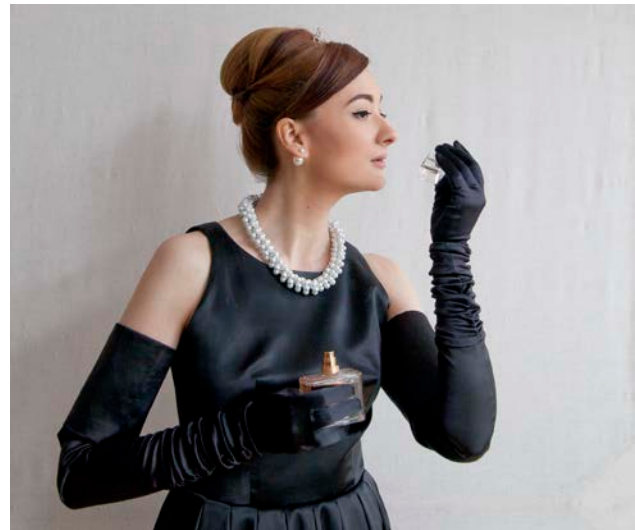
Рис. 4. Створений цілісний образ

Процес виникнення в свідомості модельєра художнього образу дуже складний, найчастіше він пов'язаний з появою не одного єдиного, а відразу декількох образів, що виникають один за одним, близьких або різних (рис. 4).