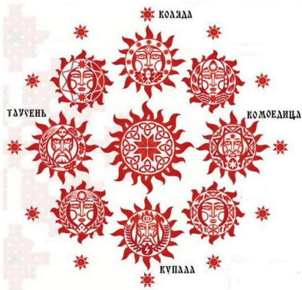
Рис. 1. Найважливіші святодні колороку язичницьких слов'ян, що адаптувалися до християнської культури: Коляда – 25 грудня, Комоєдица – масляниця 25 березня, Купала – 24 червня, Таусець-Родогощ – 24 вересня

стало невід'ємною частиною робіт багатьох сучасних дизайнерів.